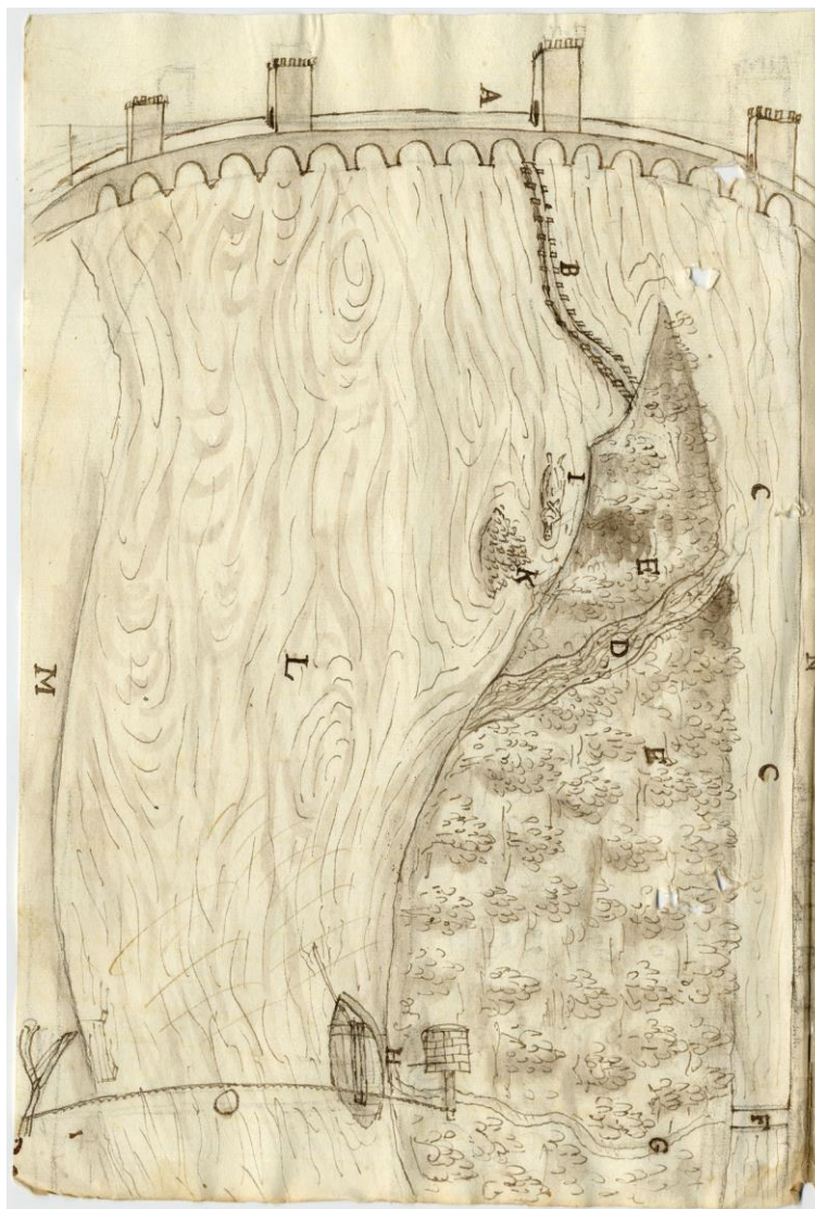
Imagen 2: Plano del lugar del crimen