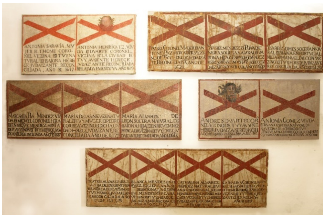
Sambenitos del Museo Diocesano de Tui

En la visita realizada en 1609, el inquisidor Ochoa recibió 245 testificaciones que descubrieron la existencia de cristianos nuevos de judíos no sólo en Tui si no también en Ourense, Redondela, Vigo y Pontevedra (Contreras, 40). En Tui, fueron denunciados, al menos, siete de los catorce vecinos cuyo nombre, delito y sentencia han quedado escritos en los, tradicionalmente llamados, “sambenitos”, conservados en el Museo Diocesano (Casas Otero, 15-31). El hábito o sambenito era una vestidura formada por dos bandas de tela, una delante y otra atrás, a guisa de escapulario religioso, pero sin capucha, sobre las que se cosían dos cruces de tela roja, una delante y otra detrás. Los condenados tenían que llevarlo puesto durante todo el tiempo que durase su sentencia y, una vez terminada su penitencia, se colgaban en las iglesias para que quedase constancia del delito cometido. Cuando éstos se deterioraban o se hacían ilegibles por el paso del tiempo, se restauraban o se reemplazaban por paños de lino amarillo con detalles completos del nombre, linaje, crimen y castigo del culpable (Pérez, 351-352). Es en este último grupo, precisamente, donde hay que encuadrar los catorce sambenitos, correspondientes a 13 mujeres y un hombre, conservados en Tui. Su importancia radica no sólo en la información que aportan sobre los condenados sino en la excepcionalidad de su conservación.