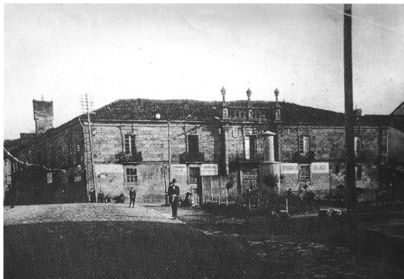
(Pita Galán, 167)

La convivencia entre ambas instituciones no fue fácil y, tras numerosos conflictos los monjes decidieron buscar una nueva ubicación para el Tribunal. El lugar encontrado fue “la casa que llaman de Calo”, también llamada Casa Grande del Hórreo, situada extramuros en un solar con huerta frente a la Porta da Mámoa (Pita Galán, 159-161).