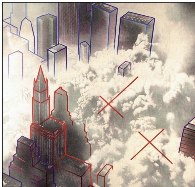
Imatge 1. Antoni Miró, “Moment clau” (2012)

Zigmunt Bauman ha estudiat una multitud d'aspectes relacionats amb el món actual i la globalització. Al llibre Globalització. Les conseqüències humanes en desglossa els diversos àmbits de la vida social i les conseqüències. Paga la pena llegir el capítol 4 titulat “Turistes i vagabunds,” que comença dient “Avui en dia tots ens movem. Un moviment que realitzem sense necessitat de moure’ns de casa: fent zàping o enganxats a l’ordinador en connectem amb la xarxa.” El moviment, quin dubte hi ha!, esdevé un dels atributs més cridaners del moment que vivim.