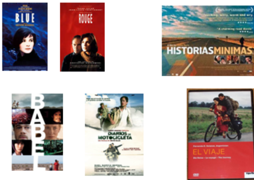
Imatge 2. Referències cinematogràfiques: Kieslowski

La presència del cinema a Gegants de gel és profusa: