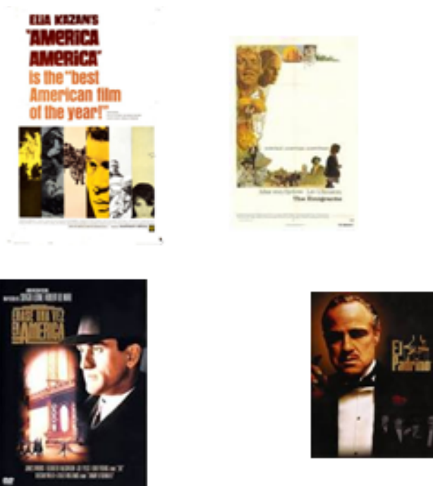
Imatge 6. Cinema