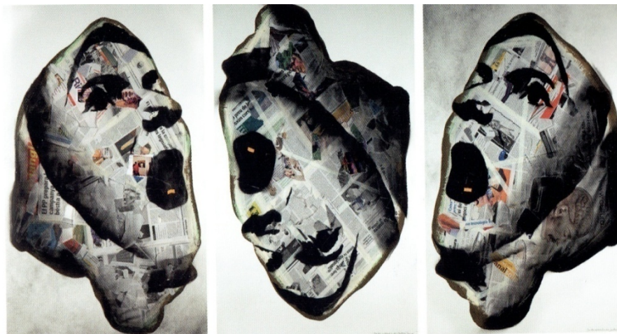
Imatge 3. La intertextualitat ha estat molt destacada en la pintura del segle XX, vet ací “La Montserrat rodolant” (2011) d’Antoni Miró un cicle que va batejar com “Pinteu, pintura.”

personatges que des de l'anonimat connecten amb fets històrics 2 . L'ingredient digressiu és un altre dels components que lliguen l'escriptura de Benesiu amb la de l'autor germànic i que convindria explorar de manera rigorosa i no podem fer en aquest treball 3 .