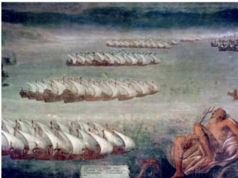
Figura 2. Luca Cambiaso. La batalla de Lepanto . Monasterio de El Escorial.