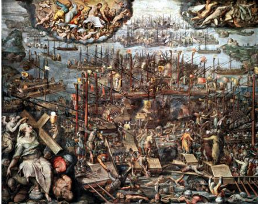
Figura 1. Batalla de Lepanto , por Giorgio Vasari. Sala Regia del Vaticano.

turcos: en el centro de la imagen, varios soldados de la Santa Liga ayudan a rescatar a un grupo de los suyos que se está ahogando, mientras que los turcos huyen sin preocuparse de los compañeros. También tecnológicamente, pues los turcos, aunque más fuertes y musculados, carecen de armadura y están armados únicamente de arco y flechas, pereciendo fácilmente ante el fuego de los arcabuces cristianos (Strunck 222).