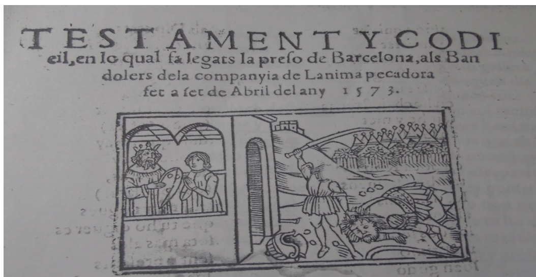
Figura 1. Testament y codicil en lo qual fa legats la preso de Barcelona als bandolers de la companyia d'Ànima Pecadora, fet a set de abril, 1573. Biblioteca Nacional de España (BNE) R/36459.

COBLES ARA NO- uament fetes dels mals y defa- ïtres a fets Ianot Poch y de la sentètia q'li hā feta.