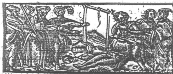
Figura 2. Cobles ara nouament fetes dels mals y desastres a fets Ianot Poch y de la sententia que li han feta. Obra del Cançoner Popular de Catalunya (OCPC), Sèrie A, Materials Aguiló, carpeta A-15, II, núm. 9.